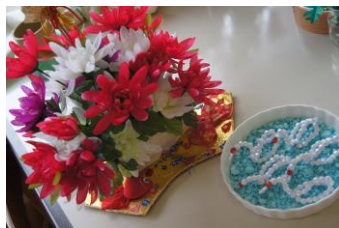
(正月飾りとビーズで作る白鳥)